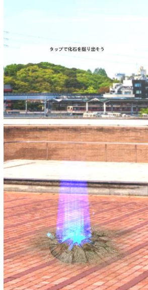
発掘ポイントを発見！タップで発掘！