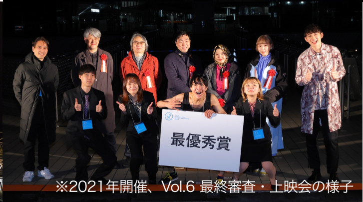
※2021年開催、Vol.6 最終審査・上映会の様子